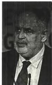
Του ΚΩΣΤΑ ΦΩΤΑΚΗ αναπληρωτή υπουργού Ερευνας και Καινοτομίας

Εάν ένα τέτοιο όραμα υιοθετηθεί από τις παραγωγικές δυνάμεις και το ακαδημαϊκό και ερευνητικό οικοσύστημα της Δυτικής Ελλάδας, η υποστήριξη του από την Πολιτεία θα αποτελέσει κατά τη γνώμη μας μονόδρομο!